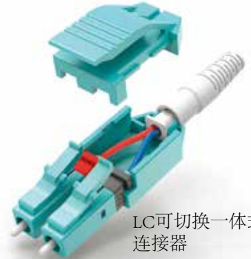
LC可切换一体式连接器