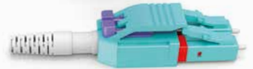
LC可切换一体式连接器带锁扣