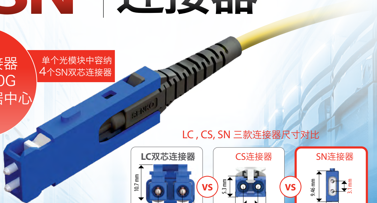
LC, CS, SN 三款连接器尺寸对比